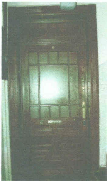
istniejące drzwi na klatce schodowej